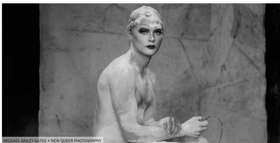
MICHAEL BAILEY-GATES + NEW QUEER PHOTOGRAPHY

Behoeftte aan een flinke dosis inspiratie uit de mode-, fotografie- of kunstwereld? Of wil je je interieur een upgrade geven door een nieuwe blikvanger in huis te halen? Look no further. Vogue zet de mooiste koffietafelboeken van dit moment voor je op een rij, zodat jou het zoekwerk bespaart blijft. Van de meest inspirerende fotoverzamelingen tot boeken vol illustraties die je aan het denken zetten – deze conversation starters wil je stuk voor stuk in huis halen.